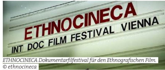
ETHNOCINECA Dokumentarfilmfestival für den Ethnografischen Film.

ETHNOCINECA. Dokumentarfilmfestival 2025