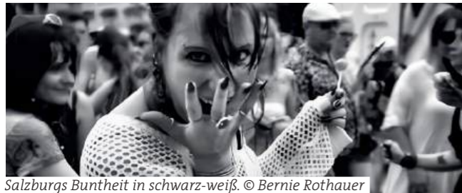
Salzburgs Buntheit in schwarz-weiß.

Stadtgalerie Rathaus, Salzburg Bernie Rothauer – Salzburg ist bunt