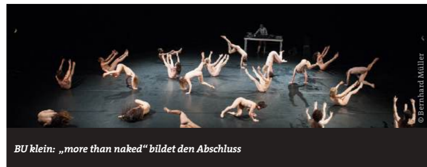
BU klein: „more than naked“ bildet den Abschluss