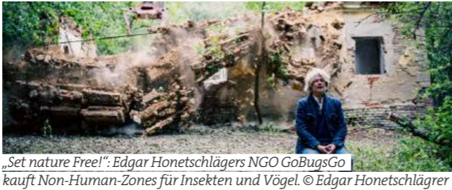
„Set nature Free!“, Edgar Honetschlägers NGO GoBugsGo kauft Non-Human-Zones für Insekten und Vögel. © Edgar Honetschläger

With "Give Nature a Break", the Nordico is dedicating a comprehensive solo exhibition to the visual artist, filmmaker and environmental activist Edgar Honetschläger. Since the 1980s, the Linz-born artist has been exploring the human/nature dichotomy through multimedia. Subtly critical and at the same time poetic and humorous, he uses surprising perspectives to question familiar points of view. In addition to a hundred works, including large-format film backdrops, a 'Non-Human-Zone' - 'a living sculpture of the 21st century' - is also a central part of the exhibition in Linz.