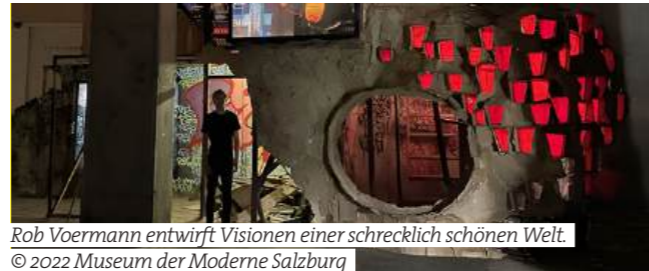
Rob Voerman entwirft Visionen einer schrecklich schönen Welt.

Museum der Moderne, Salzburg Rob Voerman. Entropic Empire