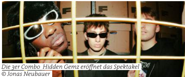
Die 3er Combo Hidden Gemz eröffnet das Spektakel

Somewhere between hip-hop, soul, R&B, alternative rock and what- ever else the genre pigeonholes offer, the Dynamo Festival can also be found. Synth pop from Sofie Royer, Viennese indie-gypsy folk Buntspecht, straightforward punk rock from the Leftovers mix with new discoveries such as singer-songwriter Ami Warning, future stadium fillers Cordoba78 and many more. As always, weather permitting, the opening - this year with the Hidden Gemz - will take place on the top car park deck of the Rhomberg multi-storey car park with a ridge view.