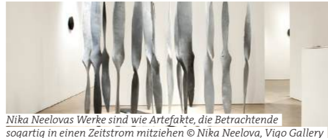
Nika Neelovas Werke sind wie Artefakte, die Betrachtende sogleich in einen Zeitstrom mitziehen © Nika Neelova, Vigo Gallery

Museum der Moderne Salzburg Nika Neelova. Cascade