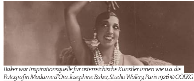
Baker war Inspirationsquelle für österreichische Künstler:innen wie u.a. die Fotografin Madame d'Ora. Josephine Baker, Studio Waléry, Paris 1926 © ÖÖLKG

Josephine Baker is an icon, was a global star, a freedom fighter and stood up against racism. She conquered a global audience singing and dancing and used the stage to spread the message that peace, freedom and equality are a universal human right, regardless of skin colour, religion, nationality, gender or sexual orientation. The exhibition is dedicated to her early performances in Vienna, with numerous original photographs and film documents.