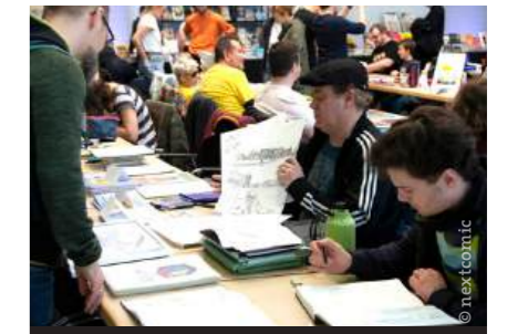
Artists bieten vor Ort spannende Einblicke in ihre Arbeit mit Interviews, Signierstunden und Vorträgen.

Köglberger wore the ÖFB team kit 28 times and scored six goals. <<