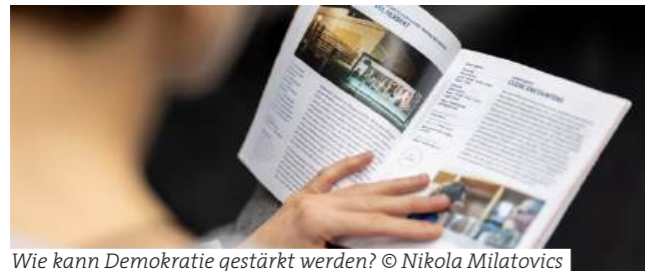
Wie kann Demokratie gestärkt werden?

Internationales Dramatiker:innenfestival Graz 2025