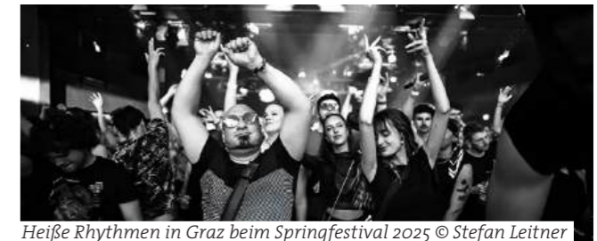
Heiße Rhythmen in Graz beim Springfestival 2025

Graz is once again at the centre of electronic art and music. Live concerts, live electronic performances, DJ sets, visual art and interactive installations will once again make the springfestival a best-of of the international electronic art and music scene. The spectacular festival location of the springfestival has always been the entire city centre of Graz. Clubs, bars, parks, warehouses, the inside of a mountain, market squares and spontaneous guerrilla-style public spaces are the diverse venues for the festival, which is unique in Europe.