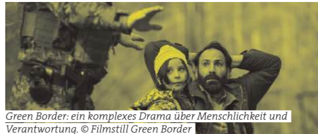
Green Border: ein komplexes Drama über Menschlichkeit und Verantwortung.

This year's festival is dedicated to the focus 'Regression & Progress' - an area of tension that is deeply rooted in our history, society and politics. The films and programme items of this year's festival are about this balancing act: about crises that trigger change, about losses that lead to reorientation, about people who rebel against stagnation and fight for their future. Some stories tell of setbacks, others of courageous visions. But they all raise the question: What does it take to turn regression into progress?