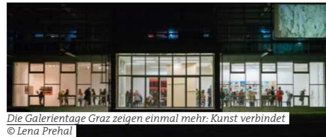
Die Galerientage Graz zeigen einmal mehr: Kunst verbindet

Around thirty galleries and art institutions invite visitors to experience the diversity and quality of contemporary art up close. Major institutions such as Kunsthau Graz, KULTUM and Neue Galerie are represented, as are organisations such as kunstGarten, < rotor >, esc medien kunst labor and rhizom, and galleries such as Galerie Sommer, Galerie Bachlechner and Galerie Grill. The FKK Kunstfreundeskreis Graz is also represented again with a mediation project: 'Let's be friends and Let's meet friends' - a tour that connects art, places and people.