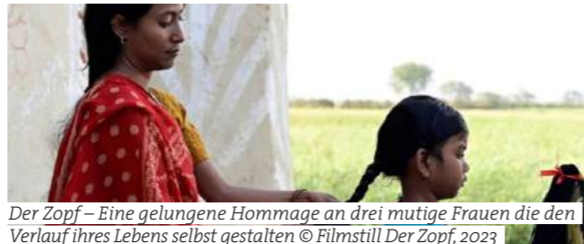
Der Zopf – Eine gelungene Hommage an drei mutige Frauen die den Verlauf ihres Lebens selbst gestalten

It's hard to imagine Hard without 'hardmovie'. Numerous film fans enjoy international films from various genres every year. Carefully selected film adaptations on the big screen guarantee excitement and the best entertainment for young and old every year. The Festwiese am See offers the perfect open-air location and promises a cinema experience for all the senses. This year, too, the film selection is quite literally impressive: The Colour Purple, the legal drama Anatomy of a Case and the drama The Pigtail are just a few examples.