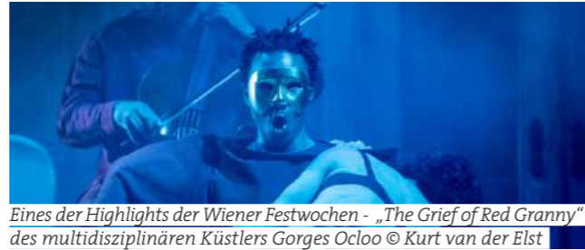
Eines der Highlights der Wiener Festwochen - „The Grief of Red Granny“ des multidisziplinären Künstlers Gorges Ocloo

For five weeks, Vienna becomes the REPUBLIC OF LOVE! Following the deliberately political edition of 2024, this year's Wiener Festwochen turn their focus to the many facets of love. Under V is for loVe, grand classics meet intimate monologues, deep discussions intertwine with ecstatic celebrations, and music theater encounters political art. What does love mean? How do desire, trust, and community connect with power, loss, and conflict? A program that opens up diverse perspectives and invites reflection.