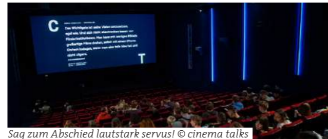
Sag zum Abschied lautstark servus!

Cinema Talks 2025 - Internationales Kurzfilmfestival Graz