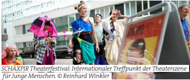
SCHÄXPIR Theaterfestival: Internationaler Treffpunkt der Theaterszene für Junge Menschen.

Under the motto 'What remains', the 2025 theatre festival is dedicated to the questions of where we come from and where we are going. The great global stories - stories of creation, myths, fairy tales, birth and death - will be told across cultures, multidimensionally and diversely. This year, the festival will take place over eleven days for the first time. This means that schools have enough time to attend the performances and, thanks to the Whitsun holidays, families can also enjoy the SCHÄXPIR hustle and bustle in Linz.